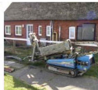
Individuální možnosti pro nástavby/přeprava...