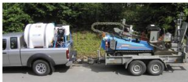
Přeprava GRUNDODRILLu 4X a MA 04 Pick-upem možná