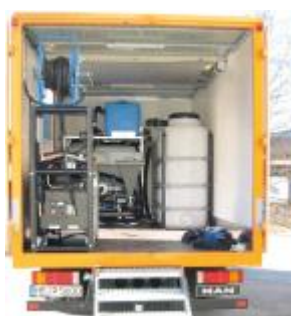
a míchací systém